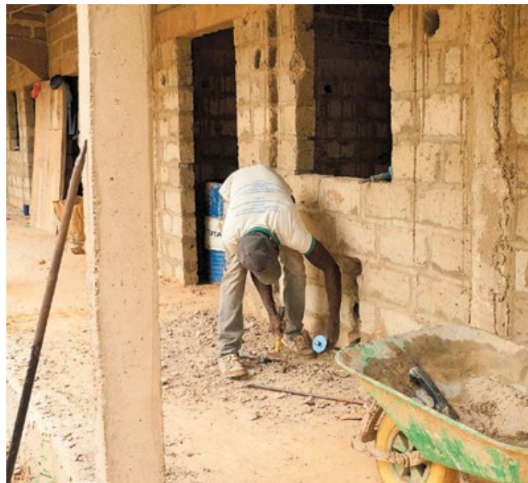
Bouwwerkers aan het werk aan het safehouse: een eenvoudig, functioneel gebouw en tegelijk een paradijs.

naar de islam. Daarom willen we gezinnen kunnen opvangen. En dus gaan we op ons terrein straks ook een onderkomen bouwen voor gezinseenheden, met een keuken en alle andere basisvoorzieningen.' In 2015 riep de Gambiaanse dictator Yahya Jammeh zijn land uit tot een islamitische staat. Deze zet van Jammeh – aan de macht